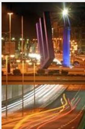
Die "Ettlinger-Tor-Skulptur" von Andreas Helmling und Alexander Grünwald