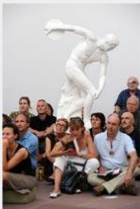
Besucher in der Staatlichen Kunsthalle

Die Kunststadt Karlsruhe wird von fünf starken, tragenden Säulen geprägt: der Kunstausbildung, der Kunstvermittlung, der Kunstproduktion, dem Kunsthandel und der Kreativwirtschaft. Mit diesen Säulen hat Karlsruhe weit über die Stadt- und Landesgrenzen hinaus internationale Reputation erlangt. mehr >>