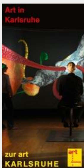
Flyer Art in KARLSRUHE zur art KARLSRUHE - Titelbild

„Als die Räder laufen lernten“ - so könnte man die Geschichte des Fahrrades anfangen, denn tatsächlich begann sie mit der Laufmaschine, einer Erfindung des Karlsruhers Karl Friedrich Drais (1785-1851), der in diesem Jahr 225 Jahre alt geworden wäre. Anlass genug, um ihn mit zahlreichen Veranstaltungen rund um die Draisine und das Fahrrad gebührend zu feiern. mehr >>