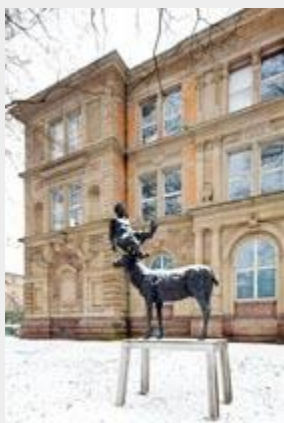
Vor der Akademie: Skulptur "Mann mit Hirschgeweih" von Stephan Balkenhol