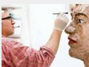
Stephan Balkenhol