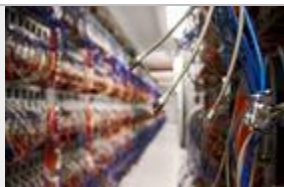
Rechenzentrum bei 1&1