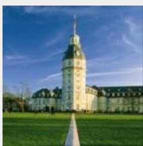
Majolika-Kachelweg zum Karlsruher Schloss

Die Stadtmarketing Karlsruhe GmbH hat zwei Kernaufgaben: die Stadt attraktiver zu machen und ihre Stärken zu kommunizieren. Um Karlsruhe wirkungsvoll zu positionieren, konzentriert sich das Stadtmarketing auf die vier Stärken der Stadt: Die IT-Region Karlsruhe, die Kunst und Kultur in der Stadt, Demokratie und Recht sowie die Lebensqualität. mehr >>